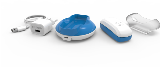
Figur 1: Obsah balenia