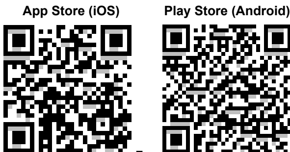
Tabell 1: Mobile App QR Codes

Sledovač je teraz pripravený na použitie.